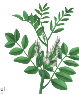
Süßholzwurzel Liquiritiae radix